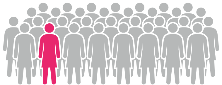
Voor elke miljoen vrouwen zullen ongeveer drie tot vijf LAM hebben.

Echter, bij andere vrouwen zal de longfunctie sneller achteruitgaan in de loop van de tijd, zij kunnen behandeling nodig hebben met zuurstof, medicijnen en/of een longtransplantatie. LAM treft ongeveer 2 op de 100.000 vrouwen.