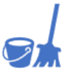
Prodotti per la pulizia